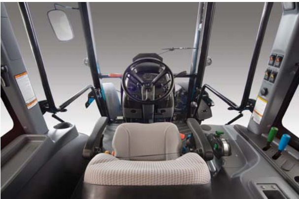
Rahat kullanım sağlayan, geniş görüş açısına sahip, düz platformlu ergonomik kabin