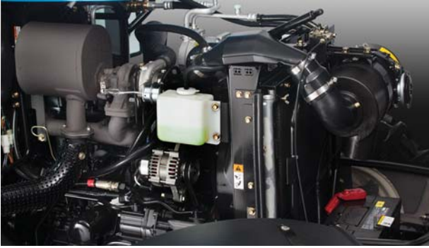
16 valfli, sessiz, uzun ömürlü, düşük yakıt tüketimine sahip Mitsubishi teknoloji EURO 3 turbo motor