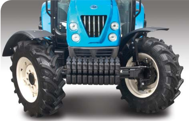
57°'ye varan üstün manevra kabiliyetine sahip ön dingil sistemi